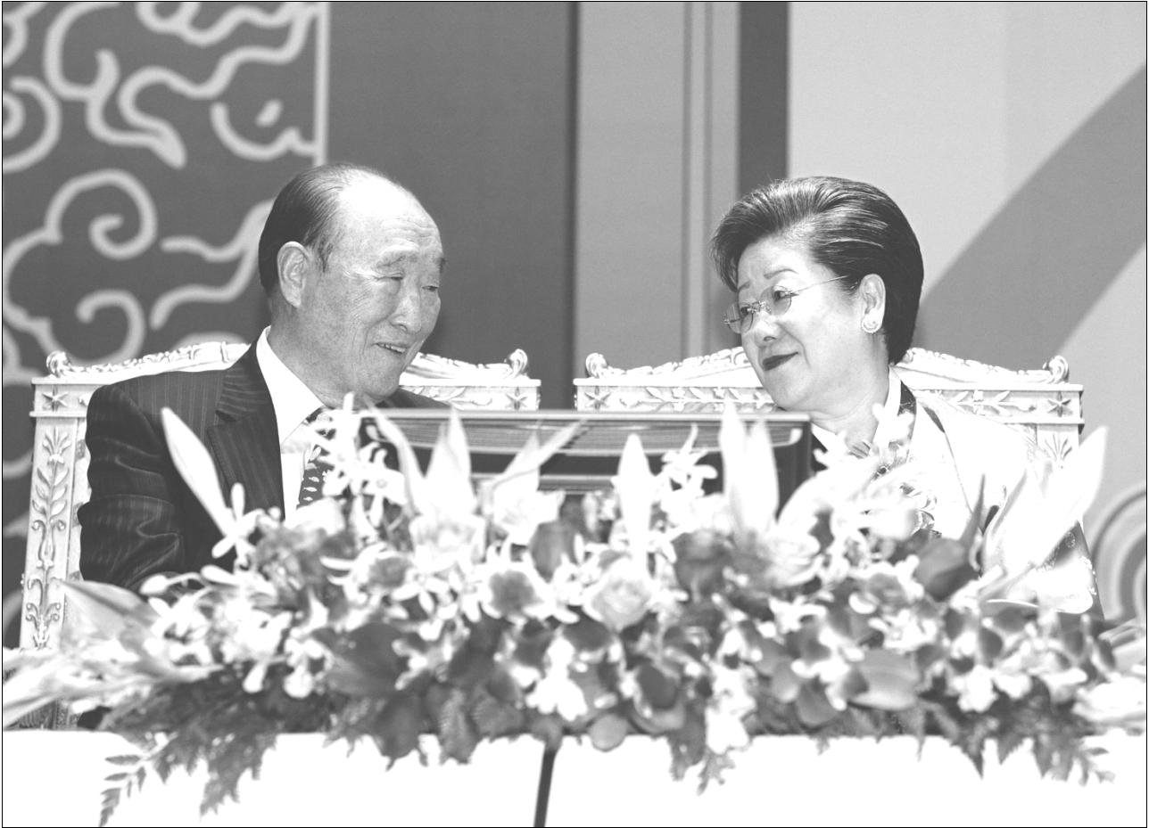
Le révérend Sun Myung Moon et madame Hak Ja Han Moon