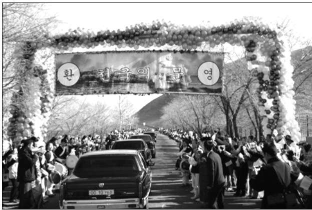
Un accueil chaleureux à l'arrivée du révérend et de madame Moon en Mongolie.

Chers dirigeants mondialement respectés, comment définir le but ultime de Dieu en créant l'être humain ? Tout simplement, éprouver de la joie en relation avec des familles idéales remplies d'amour vrai*. À quoi ressemble alors une famille idéale ? En créant les premiers êtres humains, Dieu fit d'Adam le modèle représentant tous les hommes et d'Ève le modèle représentant toutes les femmes. Il espérait les voir passer maîtres dans l'amour vrai. Pour parfaire leur caractère dans l'amour vrai, le plus court chemin était d'ancrer fermement leur lien filial avec Dieu. Ils auraient dû devenir une famille idéale qui soit un modèle de paix et dont les membres honorent Dieu comme leur Père. Autrement dit, ils auraient dû établir une famille soudée avec Dieu et vivre ainsi éternellement dans la joie.