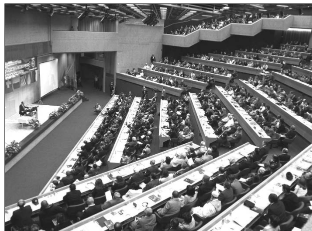
Le révérend Moon s'adresse à des Ambassadeurs de paix de toute l'Europe, le 17 novembre 2005, au Centre international de conférences de Genève, en Suisse.

Permettez-moi de me répéter : pour ressembler à Dieu, l'Être originel d'amour vrai, nous devrions devenir les souverains de l'amour vrai. Nous devrions incarner l'amour vrai et le pratiquer pour développer notre personnalité. Tel est le seul chemin pour que nous puissions également devenir de vrais parents.