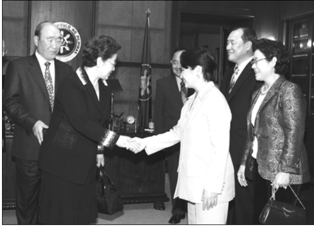
Le 1 er décembre 2005, le révérend et madame Moon sont reçus par madame Gloria Macapagal-Arroyo, présidente de la République des Philippines, au palais présidentiel de Malacanang à Manille.

Pendant, à cause de la chute, tout cela est tombé sous le contrôle de Satan. Dieu est comme un père qui, sa vie entière, a travaillé et versé sa sueur afin d'accumuler des biens pour ses enfants, pour avoir finalement affaire à un voleur qui lui a tout dérobé en une nuit.