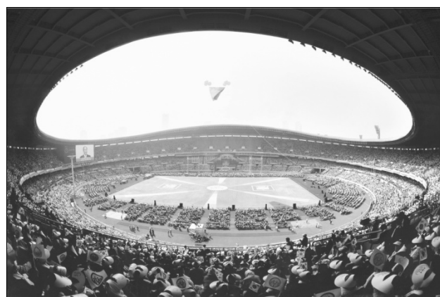
Rassemblement pour le retour de la patrie vers Dieu (3 avril 2006 – Stade olympique de Séoul, Corée)

À présent ces deux sphères, la sphère mondiale de type Abel et celle de type Caïn, doivent s'unir pour ensuite faire corps avec la Fédération pour la paix universelle qui a été initiée en position de souveraineté de type Abel. Pour bâtir le Royaume du monde idéal de paix sur cette terre, il est essentiel que les barrières entre les nations et toutes les autres barrières, soient enlevées à un niveau qui transcende la religion et les nations. J'aimerais vous le rappeler, c'est ainsi que toute l'humanité pourra entrer dans le monde de l'idéal originel de la création. Notre destinée, c'est d'accomplir la responsabilité qui consiste à établir le droit originel de propriété, perdu lors de la chute d'Adam et Ève.