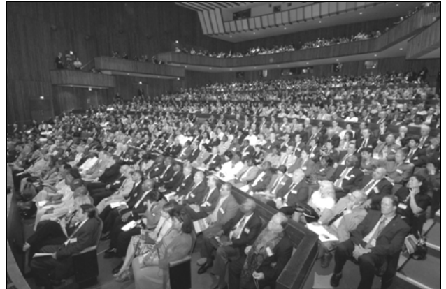
D'éminents délégués de cent trente et un pays prennent part à l'assemblée inaugurale de la Fédération pour la paix universelle, dans l'amphithéâtre Alice Tully du Lincoln Center de New York, le 12 septembre 2005.

Les Nations unies apportent une contribution non négligeable à la paix dans le monde. Il n'empêche : on s'accorde largement à dire, au dehors de l'institution comme en son sein, que, pour son sixantième anniversaire, l'ONU a encore beaucoup à apprendre sur la façon d'honorer les objectifs fondateurs de 1945.