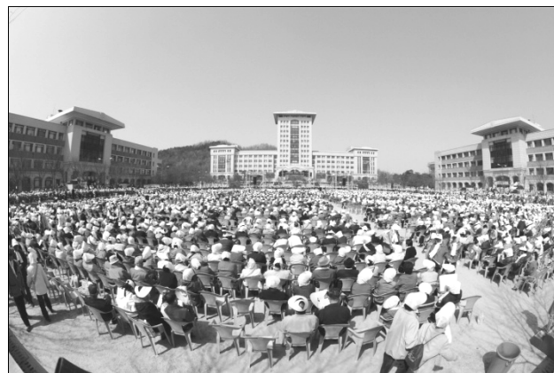
Rassemblement pour le retour de la patrie vers Dieu (avril 2006, université Sun Moon, Corée)

Veillez, s'il vous plaît, inscrire profondément dans vos cœurs cet avertissement céleste que je vous ai transmis aujourd'hui. Souvenez-vous que la seule façon d'hériter le lignage céleste, d'assurer les sphères de délivrance et de libération complètes, que Dieu a désirées ardemment voir, et d'établir pour l'éternité sur cette terre les familles idéales de Dieu ainsi que le Royaume du monde idéal de paix, est de recevoir la Bénédiction en mariage sacré des Vrais Parents.