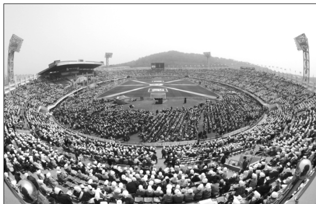
Rassemblement pour le retour de la patrie vers Dieu (28 mars 2006 – Changwon, Corée)

vrai donne joyeusement. Nous le trouvons dans le cœur joyeux et tendre d'une mère qui berce son bébé dans ses bras et qui le nourrit à son sein. L'amour vrai est un amour sacrificiel comme lorsqu'un enfant de piété filiale obtient sa plus grande satisfaction en aidant ses parents. Dieu a créé les êtres humains sur la base d'un tel amour : absolu, unique, immuable et éternel, en investissant tout sans aucune attente ni condition de recevoir quoi que ce soit en retour.