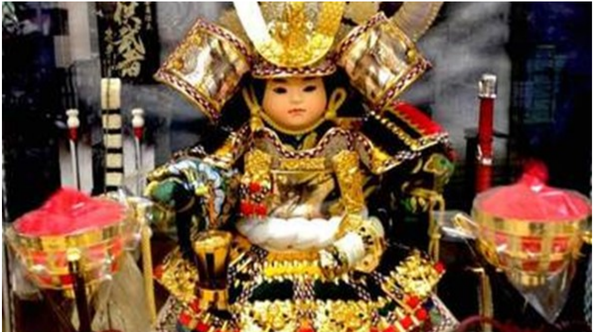
Le kabuto, réplique miniature des anciennes armures de samouraï, offertes aux petits garçons japonais le 5 mai.